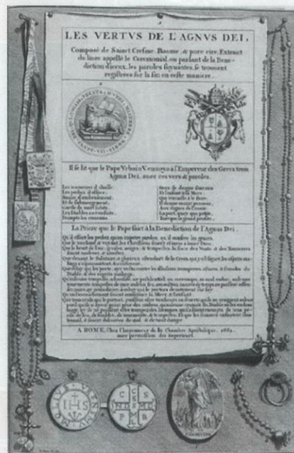
Publicatie van 'De Deugden van de Agnus Dei'

Met de komst van het Christendom bleek al snel dat dit diepgewortelde heidense geloof, maar moeilijk was uit te bannen. De christenen deden er alles aan om dit tot een ommekeer te brengen. Dus hebben ze in plaats van het 'lustrale' (of 'zuiverende') water het wijwater ingevoerd. In plaats van de 'amuleta' (amuletten) hebben zij de christenen geraden zich met het teken van het Kruis te wapenen, bijvoorbeeld met de hand op het voorhoofd, het lichaam of bijvoorbeeld op een wapen.