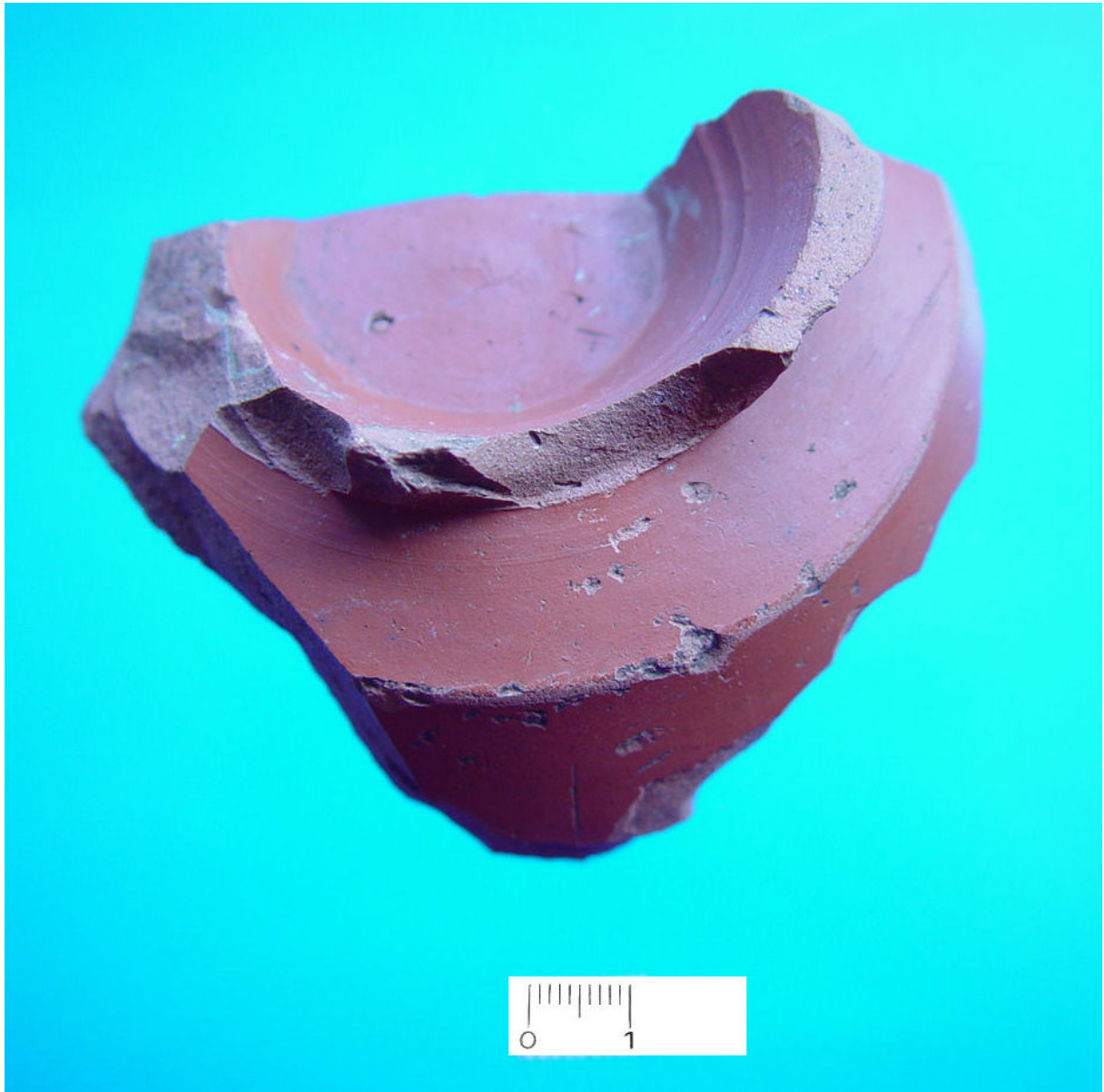
Terra Sigillata scherf