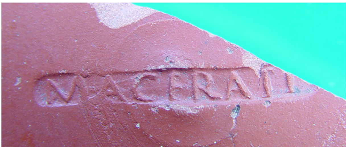
Stempel aan binnenzijde